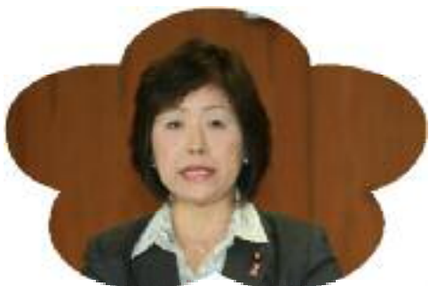
(公明党の総括意見を発表)

答： 保護者を筆頭に就学前の幼稚園・保育園、そして医療機関、企業との連携が必要と考え、検討している。