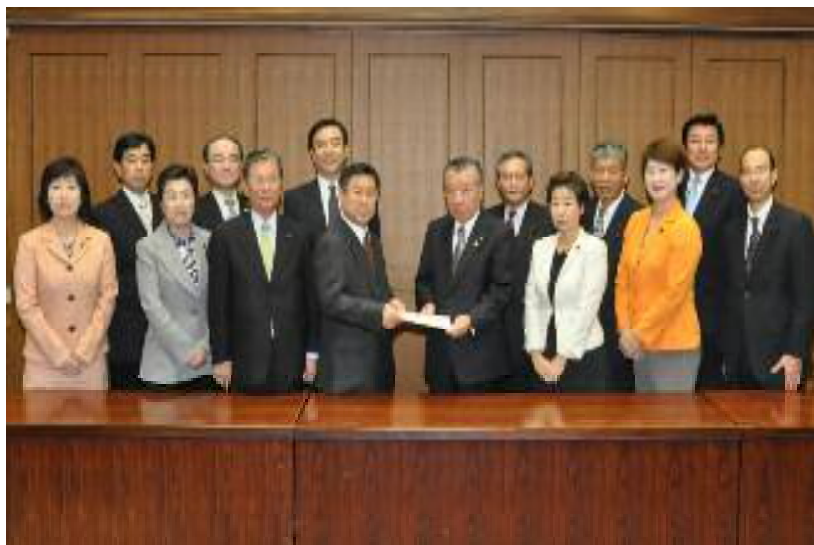
(多田区長に要望書を提出する区議会公明党)

本区内の小中学校でも新型インフルエンザが流行し、学級閉鎖が相次いでおります。優先接種の方のワクチン接種が11月9日より始まるのに先立ち、江戸川区議会公明党は平成21年11月5日に江戸川区長あてに、「新型インフルエンザワクチン、肺炎球菌ワクチン接種への公費助成を求める緊急要望書」を提出いたしました。その結果、下記の要領で公費助成が実現しました。公明党は皆様の命と生活を守るために今年も皆様の一番近くで働きます！！。