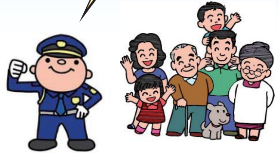
西葛西駅前の防犯カメラの設置を喜ぶ地域の皆様と 平成24年10月

地域を見守る防犯カメラ 西葛西駅周辺には5ヶ所13台 葛西駅周辺には6ヶ所13台 葛西臨海公園駅には1ヶ所4台