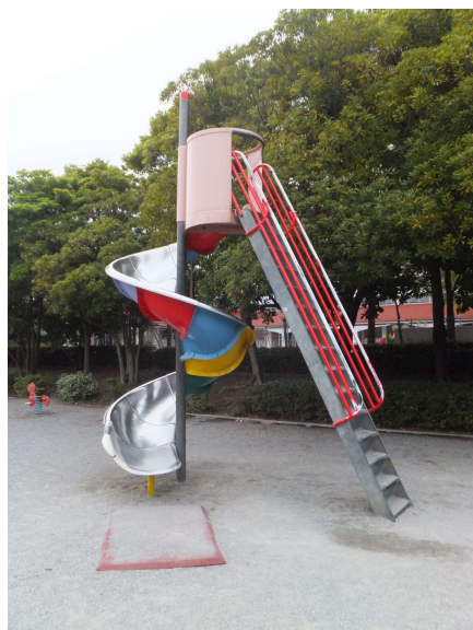
幼稚園児が転落した急な滑り台