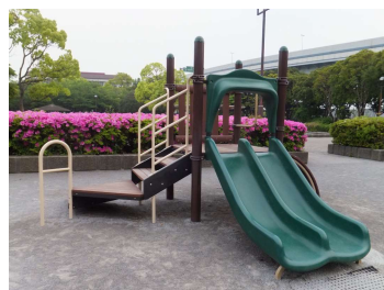
幼児用滑り台の設置 (H 24)

清新町やまびこ公園とかもめ公園には昭和60年頃、公園開園当時に設置された急な滑り台があります。やまびこ公園は私立幼稚園が隣にあり、退園した後に子供たちがよく遊んでいます。毎年滑り台の途中から転落する事故が起きています。今年の1月にもご相談があり、水とみどりの課に調査検討を依頼し、早速転落防止の手すりを設置。安全対策をしました。