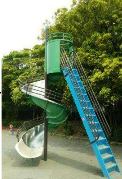
転落防止手すりを設置