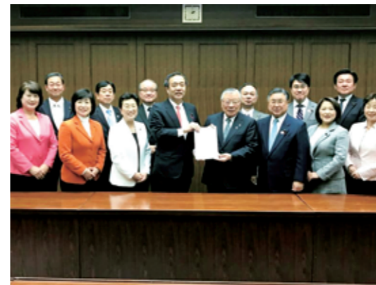
平成31年度予算要望書を提出する区議13名