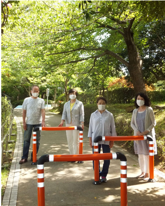
(長年の要望が実現し、喜ぶ清新町の皆様と)

清新町の緑道から西葛西7丁目に向かう通路は自転車に乗ったまま降りる人が多くて危険とのお声を数年前から頂いており、区に要望を重ねてきました。このほど、新長島川親水公園の改修と合わせて、柔らかい素材のガードパイプを設置する事ができました。公園内は自転車を降りましょう！歩行者優先。譲り合いの心で誰もが安全に利用できるようにしましょう！