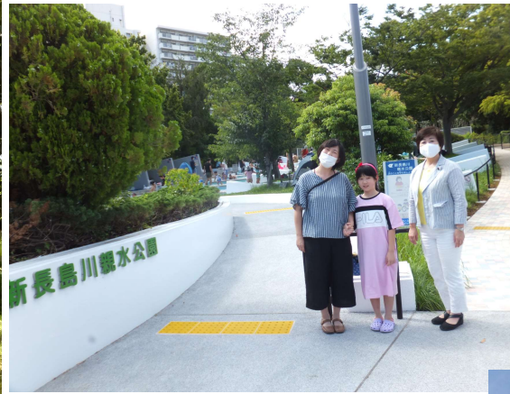
(完成を喜ぶ近隣在住の母娘と)

自転車道、歩行者道じゃぶじゃぶ池までスロープも設置され、車いすやベビーカーでも利用し易くなりました。ポンプを交換し、池のタイルも貼り替え、見違えるように綺麗になり、子どもたちは大喜びです！